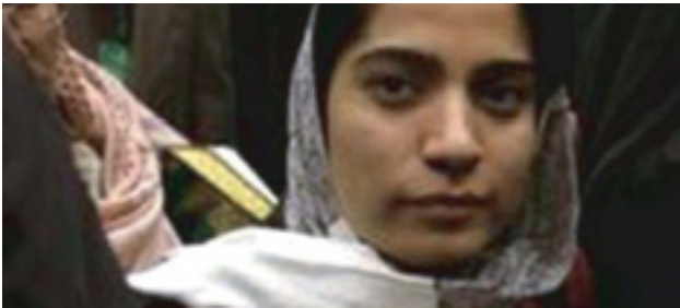
Malalai Joya

Der Sicherheitsrat der vereinten Nationen nahm im Jahr 2000 die Resolution 1325 an, die eine verstärkte Einbindung von Frauen in friedensbildende Prozesse fordert. Nichtsdestotrotz – sieben Jahre später klafft eine große Lücke zwischen den fortschrittlichen Zielen von 1325 und der Realität. Zum Beispiel wird die Intervention von militärischen Truppen, ausländischen GeldgeberInnen und Nicht-Regierungs-Organisationen (NGOs) oft dadurch legitimiert, dass auf Verbesserungen in der Situation afghanischer Frauen verwiesen wird. Aber haben afghanische Frauen wirklich das Gefühl, dass ihre Stimmen gehört werden?