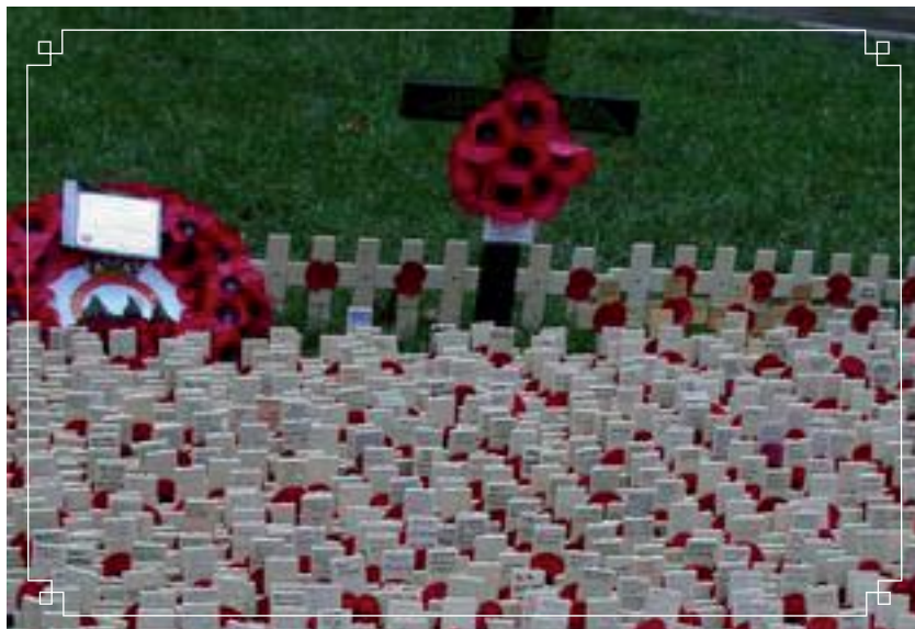
prise le 08 nov. 2002