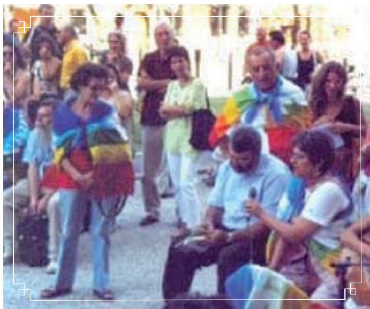
Un moment de la journée de prière et de méditation à Vicence.

A l'heure actuelle, la branche italienne du MIR se consacre surtout à cette pétition. Mais nous participons aussi à un mouvement d'opposition à l'expansion de la base militaire américaine de Vicence (le double de sa taille actuelle). Nous tâchons d'impliquer dans toutes nos actions les organisations chrétiennes et d'autres religions.