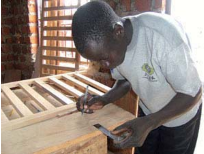
Carpentry student at Koch Goma.

Au terme des 2 ans couverts par l'accord de financement avec l'UE, les centres auront formé 778 jeunes. Soit un coût par étudiant de 87,40 euros, un montant stupéfiant.