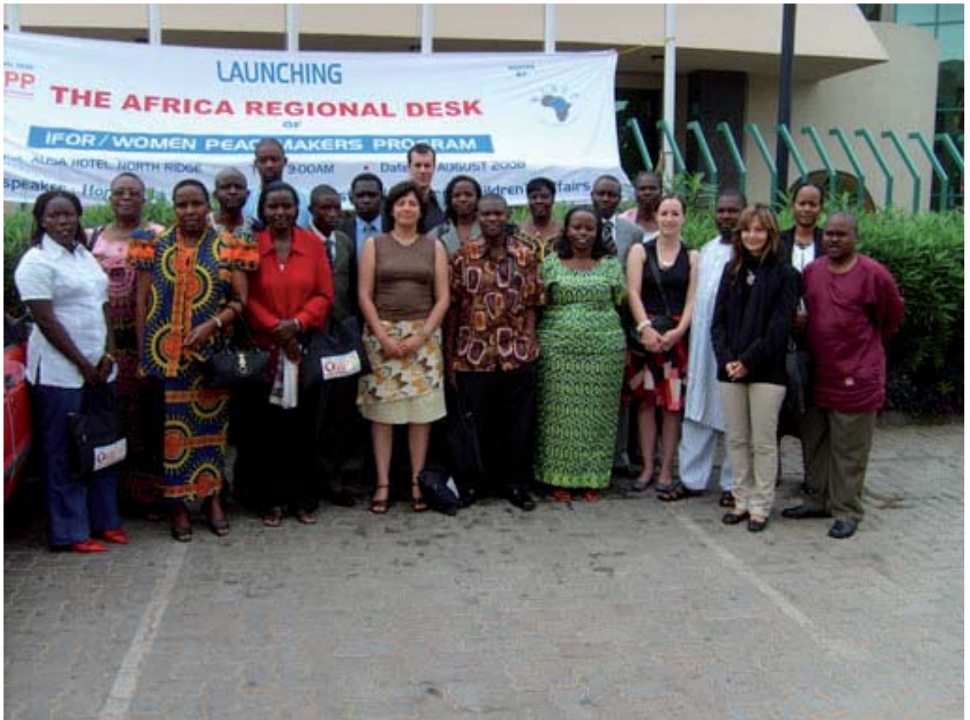
Africa Regional Desk and IFOR's WPP staff and invited guests.