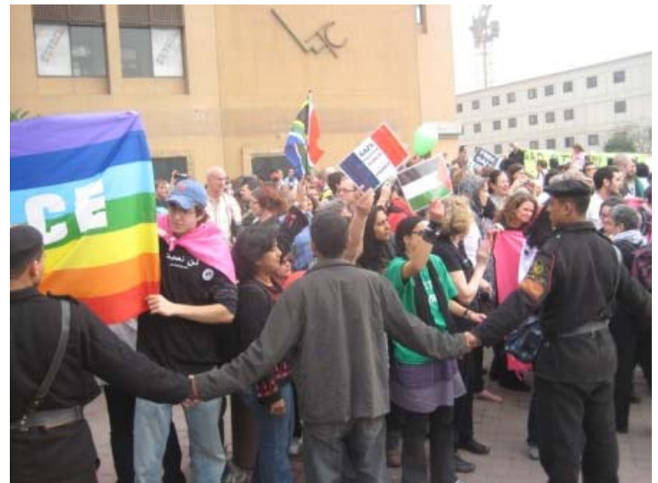
Image : Alliance "Enfants du Moyen-Orient" à Gaza, les marcheurs manifestant le droit à la liberté devant le bâtiment de l'ONU au Caire.