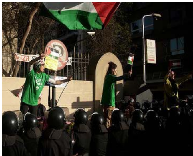
Marche pour la liberté "sit-in" dans la rue Murad au Caire.

Après les rencontres, y compris les brutalités de la part de la police égyptienne (publiées en couverture d'un certain nombre de journaux égyptiens le jour du nouvel an). Les témoignages ont prouvé que les égyptiens ont commencé à apprécier la non-violence active et la résistance passive.